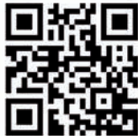
QR Code zur App

Die WayGuard-App gibt Ihnen das Gefühl, nicht alleine zu sein. Sie begleitet Sie auf Ihrem Smartphone. Wenn Sie sich auf den Heimweg machen, starten Sie die App. Nun können das Team WayGuard und von Ihnen (im Vorfeld) ausgewählte Kontakte Ihren Heimweg auf der Karte verfolgen und wissen so immer wo Sie sind. Im Notfall können Sie über den Notruf-Knopf Hilfe rufen. Wenn Sie angekommen sind, informieren Sie mit einem Klick. Die App wurde gemeinsam mit der Polizei NRW entwickelt.